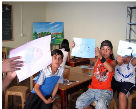
De mooiste tekeningen