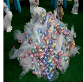
Dé 15 kg eitjes.

Gisteren ging ik op zoek naar diegene die de sleutel heeft van de Duitse burens, waar het gras bij het huis 1 meter hoog staat en in de tuin bóven mij uit.